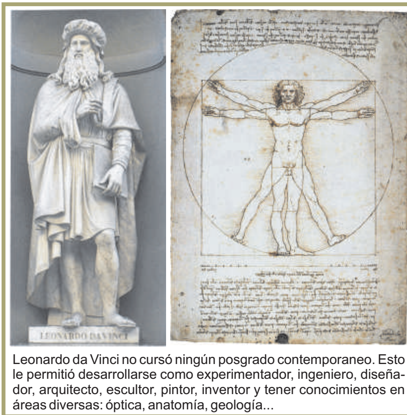
Leonardo da Vinci no cursó ningún posgrado contemporáneo. Esto le permitió desarrollarse como experimentador, ingeniero, diseñador, arquitecto, escultor, pintor, inventor y tener conocimientos en áreas diversas: óptica, anatomía, geología...

¿Y cuando se pueden pensar más globalmente los problemas de la sociedad, los problemas del mundo, (perdón por la ambición) la condición humana? ¿Eso que es, en el post, post, post, post doctorado llegamos a “condición humana”?