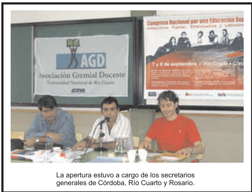
La apertura estuvo a cargo de los secretarios generales de Córdoba, Río Cuarto y Rosario.

El divorcio existente entre tareas de investigación y docencia plantea serias dificultades para el conjunto de la universidad. CONICET y agencias provinciales de promoción de la investigación, políticas de categorización según producción en investigación y políticas de incentivos constituyen otro de los instrumentos de Ministerio para fragmentar más aún el sistema universitario. El problema, claro está, no es que existan dichos organismos; el problema es que, dado los bajos presupuestos destinados a Ciencia y Tecnología, estos espacios se convierten en lugares cerrados y blindados para el acceso mayoritario de los docentes del país y que, al mismo tiempo, toda