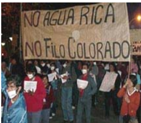
Derechos de fotografía: diario El Ancasti Versión digital: http://www.elancasti.com.ar/

A propósito de Agua Rica, recientemente la minera Alumbra elaboró un plan, que es nada más que un proyecto, el cual empezó a ser ejecutado por la municipalidad sin haberse realizado el control de impacto ambiental. En ese plan estaba contenido como proyecto el entubamiento del río, así que vayan sabiendo el pronóstico. Como la gente se opuso en realidad se sacó ese proyecto, pero se están haciendo obras tendientes a mitigar “posibles” impactos que ya les está por provocar la fase de exploración; como se han caído los cerros se provocan tajamares río arriba, que eso después si llueve mucho viene un aluvión... entonces tienen que ensanchar el río. Ahora, qué hacen: ensanchan el río, lo dejan como un canal, rompen la vegetación, perforan el acuífero Pipanaco con la intención de sacar el agua y mandarla por retro-bombeo, incorporarla al canal de riego. Y la idea de la empresa es apoderarse del agua, ya que el agua del Campo Arenal va a ser insuficiente para la explotación. Es decir, van a sacar toda el agua que se está sirviendo la ciudad de Andalgalá, la van a compensar con perforación de este acuífero, y se van a apoderar del río de Andalgalá. Eso va a ser más o menos el tema.